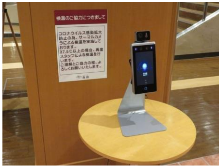
①検温の実施と発熱や風邪症状が認められた際の対応について

入館をしたら体温の計測をお願いします。 37.5度以上の発熱や風邪症状が認められた場合、保健所の指示に従い、ご宿泊をご遠慮いただく場合がございます。