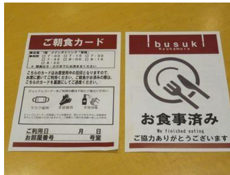
②大浴場や食事会場での3密回避対策について

フロントカウンターには、飛沫感染防止パネルを設置しております。 チェックイン時のご本人確認へのご協力をお願い致します。