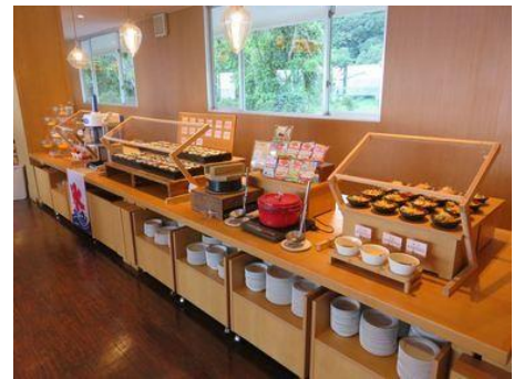
③食事の提供について

レストランでは席数を減らし、間隔を広げてテーブルを配置しております。お隣同士のお席には衝立て仕切りを設置しております。ご人数に応じて、お食事時間の拡充を行い、ご利用時間の分散化にご協力いただいております。