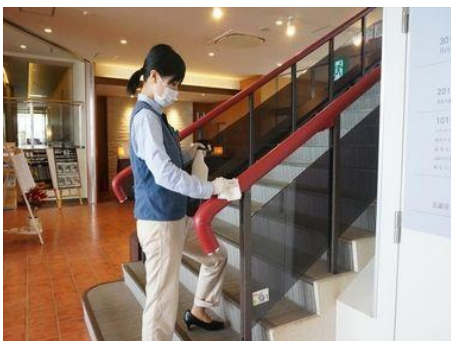
④消毒・清掃について

ビュッフェに飛沫防止のスニーズガードを設置しております。ビュッフェご利用のお客様へ使い捨て手袋の着用をお願いしております。トンダ類の共用を少なくするため、小皿での盛り分けを行っております。マスク、手袋を着用したスタッフによる取り分けをいたします。各テーブルに消毒用アルコール、カトラリーケース（お箸、おしぼり）を設置しております。